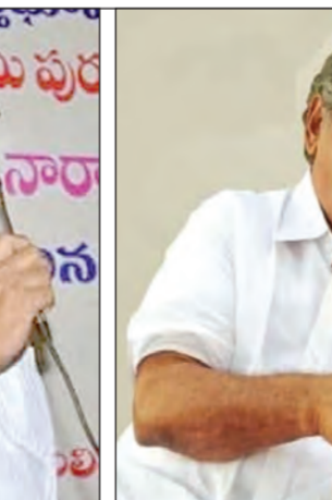
అనంతపురం, మే 19 ప్రభాతవార్త