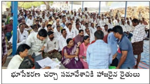
భూసేకరణ చర్య సమావేశానికి హాజరైన రైతులు