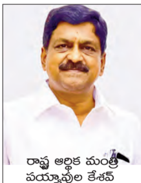
రాష్ట్ర ఆర్థిక మంత్రి పర్యవేక్షణ కేసవ్

ఉరవకొండ నియోజకవర్గంలోని ఐదు మండలాల్లోని అసంపూర్ణంగా ఉన్న 40 గ్రామ, వార్డు, సచివాలయాల నిర్మాణాల పూర్తికి రాష్ట్ర ఆర్థిక, ప్రణాళిక వాణిజ్య మన్నులు, శాసనసభ వ్యవహారాలశాఖ మంత్రి పర్యవేక్షణ కేసవ్ ప్రత్యేక చొరవతో రాష్ట్ర ప్రభుత్వం పురపాలక, గ్రామీణాభివృద్ధిశాఖ, అనంతపురం జిల్లా పురపాలక భవనాల గ్రాంటు 2026-27 కింద 9.61 కోట్ల రూపాయలు నిధులకు మంజూరు చేసింది. ఈ మేరకు ప్రత్యేక ఊటీ 430ను విడుదల చేస్తూ మంగళవారం రాష్ట్ర ప్రభుత్వ ప్రత్యేక ప్రధాన కార్యదర్శి కాంతిలాల్ దండం (ఎస్.ఎస్.ఎస్) ఉత్తర్వులు జారీ చేశారు. 2025-26 ఆర్థిక సంవత్సరంలో పీఆర్-బిల్డింగ్స్ గ్రాంటుకింద ఉరవకొండ నియోజకవర్గంలో 25.90 కోట్ల అంచనా వ్యయంతో అసంపూర్ణంగా ఉన్న 153 ప్రభుత్వ భవనాలను