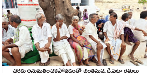
చరకు అనుమతించకపోవడంతో చింతిస్తున్న డి.పట్టా రైతులు

యాడికి మండల కేంద్రంలో భూముల విలువను జక్కటి భూములకు అన్యాయం చేసినందుకు రెండు గ్రామాల భూములకు ఎకరం రూ. 8 లక్షలకు పెంచి పరిహారం ఇవ్వగలమని జేసీ విష్ణుచరణ్ తెలిపారు. రైతుల నుంచి అభిప్రాయాలు తెలపమని జేసీ